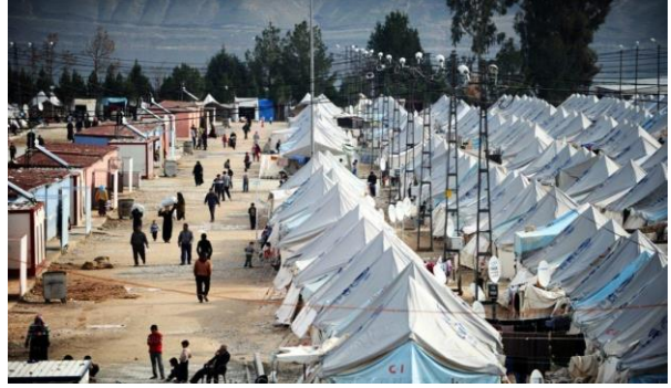
Türkiye’de Suriyeliler için kurulan merkezlerden bir görüntü..