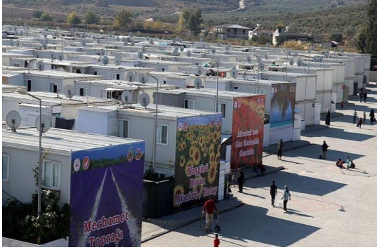
Türkiye’de kurulan “geçici koruma merkezlerinden görüntü.

Geçici barınma merkezi: Bu Yönetmelik kapsamındaki yabancılar ile Bakanlık tarafından uygun görülen kişilerin toplu olarak barınma ve iaşelerinin sağlanması amacıyla kurulan merkezleri ifade eder.