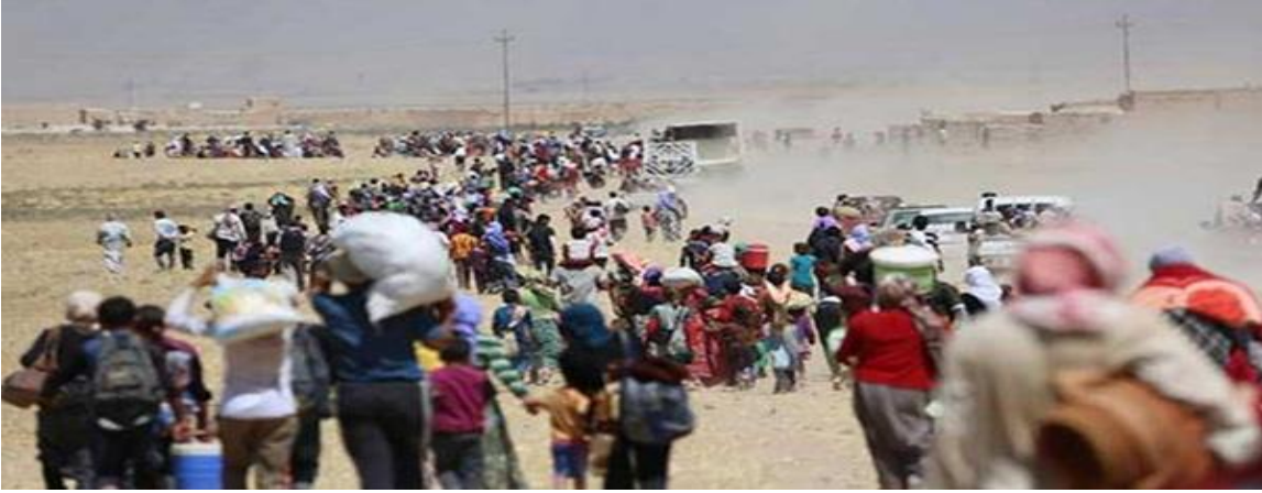
İç Savaştan kaçarak Türkiye sınırına doğru kaçan Suriyeliler....

İnsanlık tarihinde çeşitli dönemlerde, değişik sebeplerle insanlar yaşadıkları toprakları terk ederek göç etmiş veya etmek zorunda kalmışlardır. Savaşlar, isyanlar, iç karışıklıklar, ekonomik kaygılar her birisi veya birkaçı insanların kitleler halinde topluca yaşadıkları yerlerden başka yerlere göç etmelerine sebep olmuştur. Sebepleri belki farklıydı ama bu sebeplerden biri veya bir-kaçı sebebiyle insanlar her seferinde yola düşmüştür. 19. Yüzyılın sonlarında ve ağırlıklı olarak 20. Yüzyılın başlarında Osmanlı Devleti'nde Balkanlar ve Kafkaslarda yaşanan gelişmeler sonucunda kapsamlı ve kitlesel göç hareketleri başlamıştır. 1. Dünya Savaşından sonra mesele uluslararası antlaşmalarla ve "mübadele" yolu ile kısmen çözüme kavuşturulmuştur. Ancak 2. Dünya Savaşı ile yeni mağduriyetler, sürgünler ve göçler yaşanmıştır. Son yüzyıl içerisinde Türk Milletinin yaşadığı coğrafyada soykırım, sürgün ve gözyaşı eksik olmamıştır. Anadolu coğrafyasına 20. Yüzyılda Balkanlardan ve Kafkaslardan büyük göç dalgası yaşanmıştır. Ancak göç eden insanlar göç ettikleri Türkiye Cumhuriyetinde yaşayanlarla dil, din ve soy birliği içinde olduklarından büyük sıkıntı ve tartışmalar yaşanmamıştır.